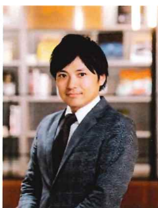
講師：落合 歩氏 リクルートブライダル総研所長